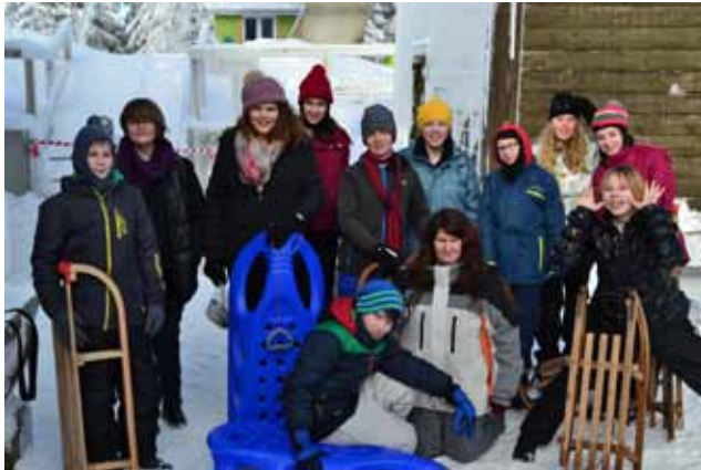
Impression aus dem Harz: Konfirmandenfahrt Ende Januar nach Clausthal-Zellerfeld