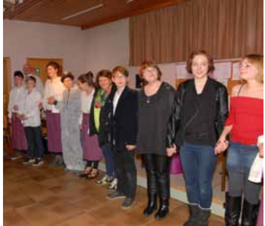
Fotos vom Krimi-Dinner in der Kleinen Kreuzkirche