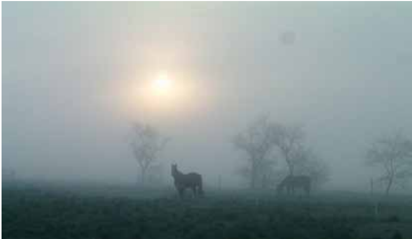
Ob Sommer oder Winter, wunderschöne Aussichten vom Kirchplatz aus- Kommen und sehen Sie selbst!